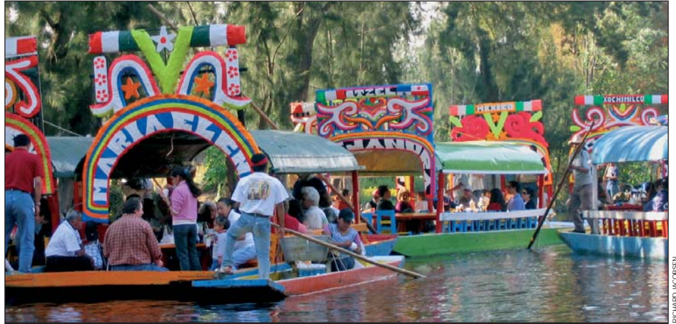
México: Canales de Xochimilco, donde conservacionistas tratan de salvar al singular anfibio axolotl. Pág. 2