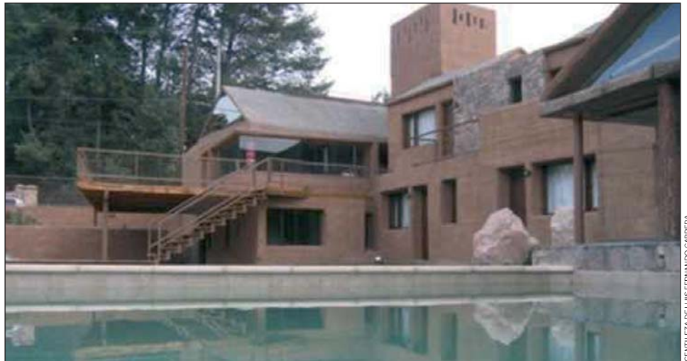
Emprendimiento turístico en Tilcara que choca con paisaje del pueblo.

Tilcara es uno de los poblados de la Quebrada de Humahuaca, que se extiende por 170 km de valles y cerros multicolores. El clima seco y la aridez de la zona contrastan con la riqueza cultural de sus habitantes, quienes conservan tradiciones y ritos milenarios.